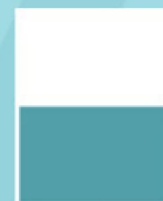
MEDIA PÁG. VERTICAL 97mm x 259mm