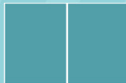
SPREAD 430mm x 275mm

Edición especial anual impresa, con circulación por país de 10.000 ejemplares.