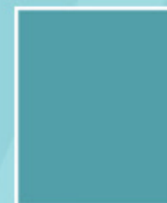
PÁGINA COMPLETA 215mm x 275mm