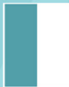
MEDIA PÁG. HORIZONTAL 199mm x 126mm